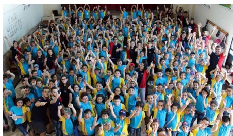
Letný saleziánsky tábor v Damasku, Sýria

V Sýrii postihnutej 12 rokov trvajúcou občianskou vojnou realizujeme so saleziánmi v hlavnom meste Damask projekt „Budovanie zručností zraniteľných skupín obyvateľstva v Sýrii pre trh práce“. Je podporený SlovakAid, oficiálnou rozvojovou pomocou Slovenskej republiky, v hodnote 199 996,20 EUR a trvá od 1. 9. 2022 do 31. 8. 2024. Jeho hlavným cieľom je zlepšiť možnosti zraniteľného obyvateľstva v Sýrii