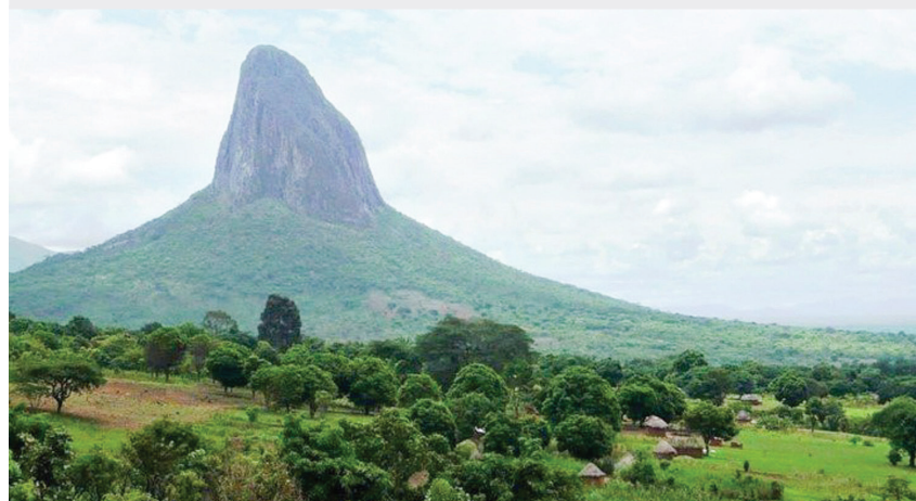
Najvyšší vrch Morro Môco

Vieš o koľko je Gerlachovský štít vyšší?