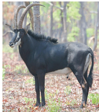
Angolským národným zvieratom je antilopa vraná, tzv. palanca negra.

Tridsať rokov občianskej vojny zničilo infraštruktúru krajiny - tisícky kilometrov ciest, železníc, destabilizovalo verejné služby, školstvo a zdravotníctvo. Celkovo si vyžiadalo asi pol milióna obetí, vyše štyri milióny utečencov a v jednotlivých