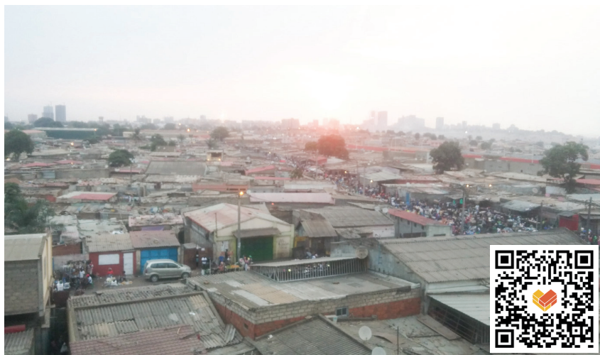
V slumoch majú domy postavené z plechov a tehál.