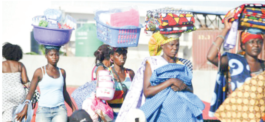
Hlavné mesto Luanda je mesto kontrastov.

V roku 2013 bolo hlavné mesto Luanda podľa rebríčka spoločnosti Mercer vyhlásené za najdrahšie mesto sveta. Napríklad fľaša mlieka tam stála viac než v New Yorku alebo Paríži. Paradoxom je, že na dohľad od moderných mrakodrapov sa rozkladajú slumy, v ktorých nefunguje voda ani elektrina.