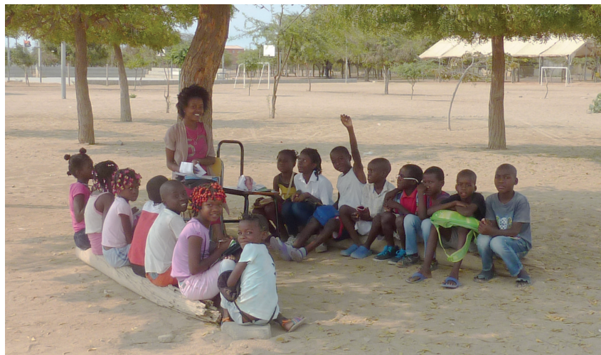
Žiaci sa niekedy musia učiť pod veľkým stromom.

skončení vojny sa ich integrácia stala vážnym spoločenským problémom.