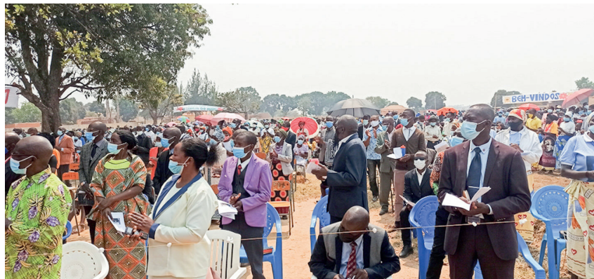
Prvá slávnostná omša v provincii Huambo, na ktorej domáci privítali saleziánov.

Nové miesto pôsobenia prináša saleziánskej komunite aj náročné výzvy. Jednak je to potreba vybudovať priestory pre komunitu a rozvíjať farské aktivity či integrovať sa medzi domácich a zistiť, aké sú ich skutočné potreby. Cieľom saleziánov je najmä služba pre ľudí a podpora ich ľudského, sociálneho aj duchovného rozvoja. Preto v blízkej budúcnosti plánujú rozbehnúť sieť oratórií, kde ponúknu voľnočasové aktivity pre viac než päťtisíc detí a mladých z okolitých dedín.