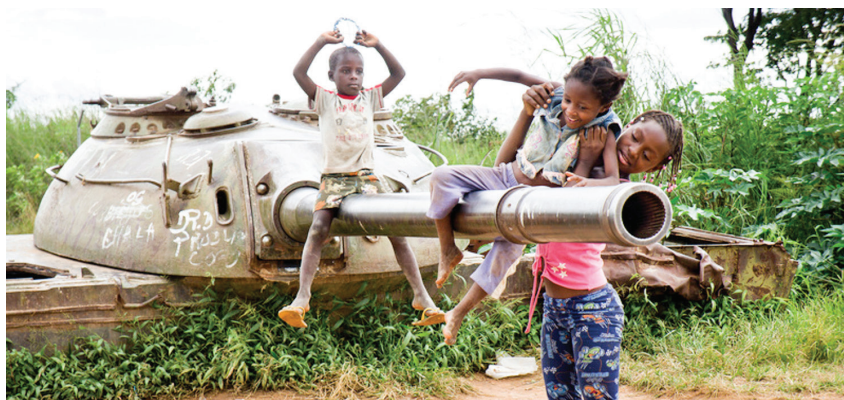
Nové preliezky pre deti.

Aj napriek tomu, že sa v krajine nachádzajú obrovské zásoby ropy, diamantov, železnej rudy, zlata a iných surovín, vysoké percento obyvateľov žije aj naďalej v chudobe. Obdobie občianskej vojny v Angole znamenalo masívny presun obyvateľstva z vidieckych oblastí do hlavného mesta Luanda, ktoré sa stalo bezpečným útočiskom. Mesto však nebolo na príchod toľkých ľudí pripravené a v hlavnom meste sa začali rozširovať chudobné štvrte, nazývané slumy. Z polmiliónového kozmopolitného mesta v roku 1975 sa tak počas tridsiatich rokov Luanda zmenila na metropolu plnú sociálnych a ekonomických kontrastov. V krajine dodnes nie je dostatočná dostupnosť pitnej vody a elektriny. Milióny domácností v noci fungujú len vďaka dieselovým generátorom.