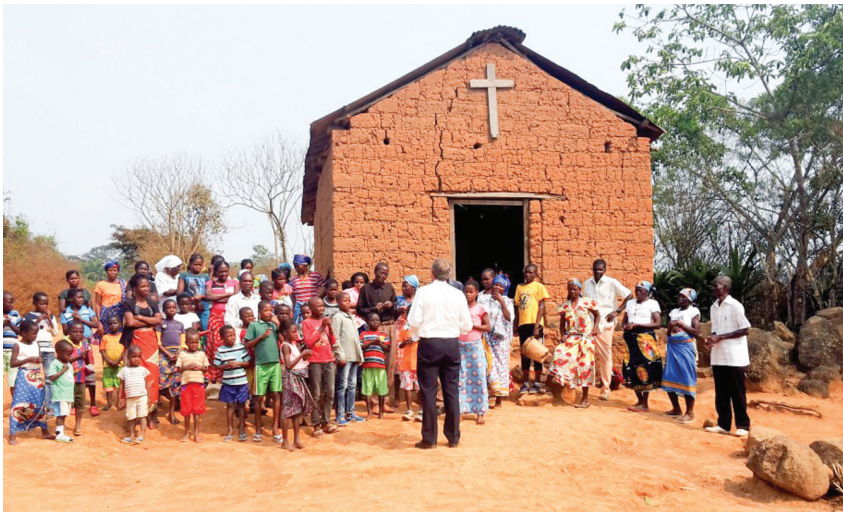
Saleziáni stavajú na dedinách aj malé kaplnky.