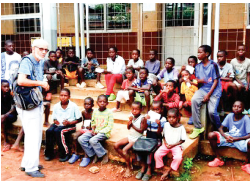
Vzdelávanie detí, mladých a dospelých je pre saleziánov prioritou.