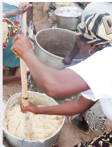
Príprava obľúbeného angolského jedla funge.

Funge je kukuričná kaša, ktorá sama o sebe nemá žiadnu chuť, preto ju zvyčajne jedávajú spolu so zeleninovou omáčkou alebo s mäsom a fazuľou. Tiež sa môže pripraviť aj z manioku, čo je plodina veľmi podobná zemiaku. Funge je však jedlo, ktoré môžete nájsť v celej Afrike známe ako ugali, fufu, pap či nshima. Viete, ako sa takáto kaša nazýva u nás na Slovensku?