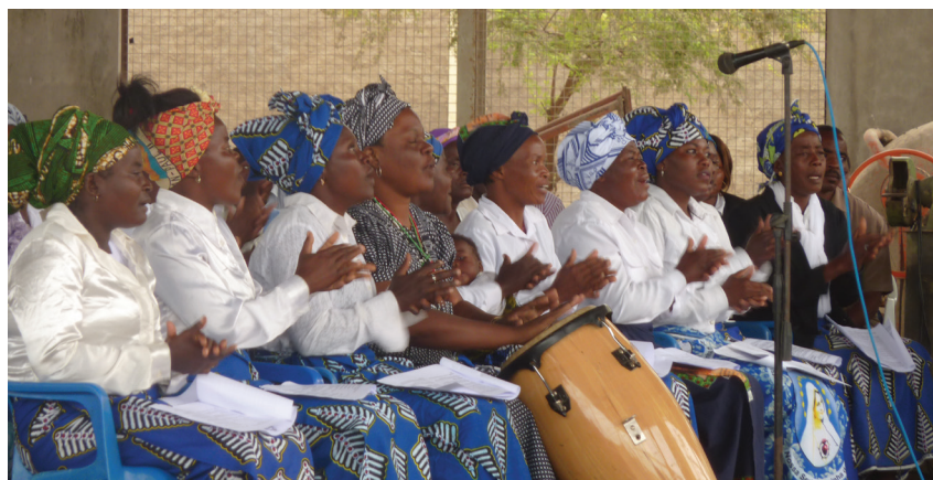
Spev a tanec sú aj neodmysliteľnou časťou sv. omše.

Veselé a farebné vzory majú aj ich tradičné látky, tzv. pano, z ktorých si vyrábajú slávnostné košele či šaty, no používajú ich aj ako každodenných pomocníkov, napríklad ako zástery, utierky, prikrývky alebo šatky na hlavu. Tradičný angolský vzor na látkach sa nazýva samakaka. Takéto šatky alebo skôr turbany nosia ženy na hlavách, najmä keď potrebujú prenášať nejaký náklad. Šatka na hlave slúži na vytvorenie rovnováhy (zamotaná ako slimák), na ktorú sa následne položí veľký lavór s rôznymi vecami od jedla, cez mydlá a šampóny až po vodu.