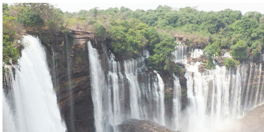
Vodopády Calandula sú vysoké 105 metrov a široké až 400 metrov.