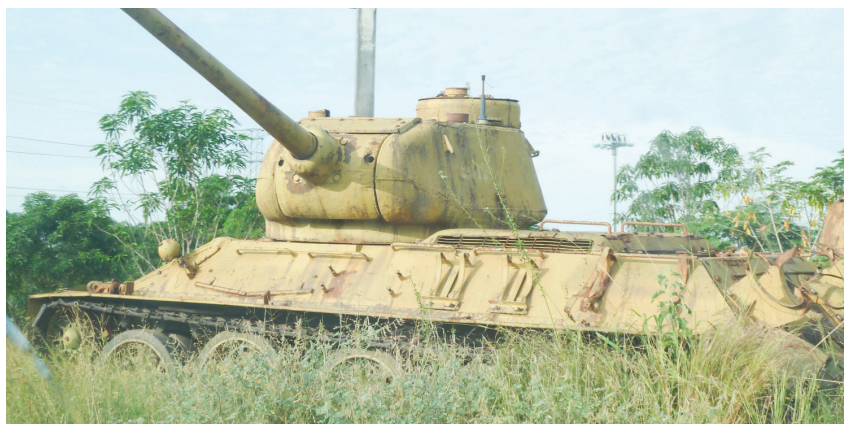
Tanky sa stali súčasťou krajiny.