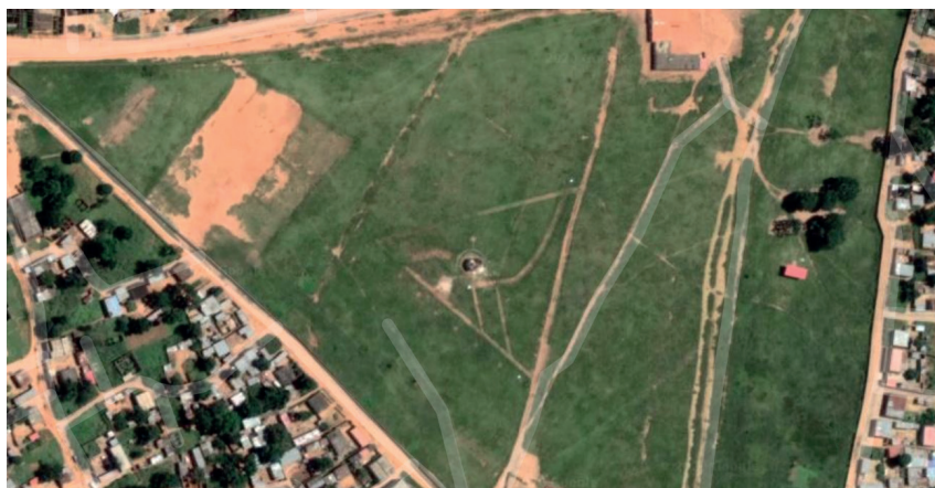
Takto vyzerá pozemok saleziánov v meste Huambo.

Avšak počty detí a mladých v oblasti komplikujú vzdelávanie na základnom stupni, keďže v niektorých triedach je viac ako 150 detí, a tak učiteľ nemá možnosť venovať sa všetkým deťom. Aj vďaka finančnej podpore zo zbierky Tehlička 2023 budú môcť saleziáni odkúpiť priestory bývalej školy, kde je aktuálne funkčných 6 tried a následne by vďaka rekonštrukcii priestorov postavili ďalších 24 tried. Takto v provincii Huambo vznikne škola Dom Bosco, ktorá poskytne možnosť vzdelávať sa tisíciam študentov.